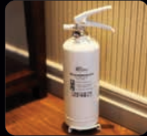
Pulversläckare 2 kg