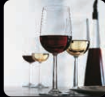
Rosenthal vinglas 6-pack