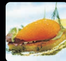
Sikrom ca 160 g