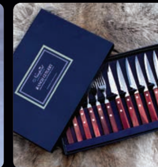
Grillbestick 6 par Knivar och gafflar i rostfritt stål med handtag av rosenträ. Kommer i snygg presentask. Tål maskindisk.