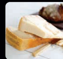
Parmesan ca 500 g