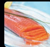
Kallrökt skivad lax ca 500 g