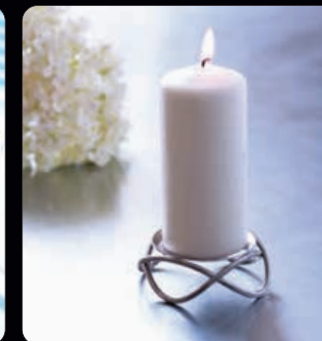
Georg Jensen Ljusstake Glow Med elegant och tidlös design förgyller ljusstaken Glow från anrika Georg Jensen upp ditt hem.