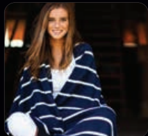
Santa Barbara pläd