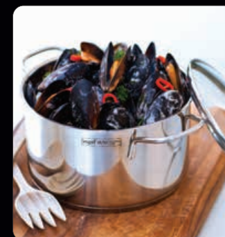
Gryta med glaslock Stilren gryta med 7 mm sandwichbotten och glaslock. Rymmer 3,5 liter och passar alla sorters spisar.