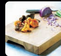
Skärbräda av ek