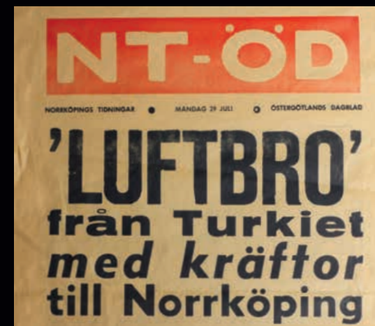
Löpsedel från 29 juli 1969 i NT-ÖD.