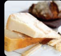
Parmesan 700 g