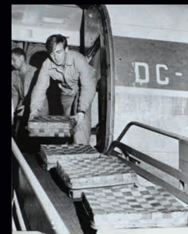
En DC 9 lastar av levande turkiska kräftor 1969.