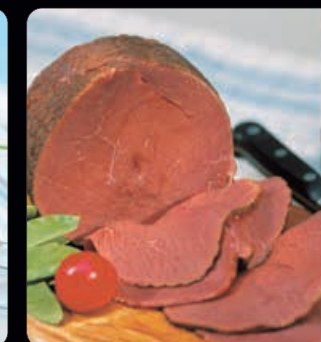
Rökt älgstek ca 550 g Bjud dina utländska kunder på en välsmakande stek från skogens konung. Älgstek från prisbelönta Tärnavilts Rökeri.