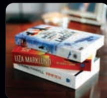
Pocketpaket 4 st böcker