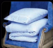
Windsor Bäddset 4 delar