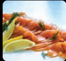
Lax Duo 2 x 400 g