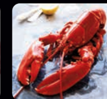
Hummer 1 st ca 350 g