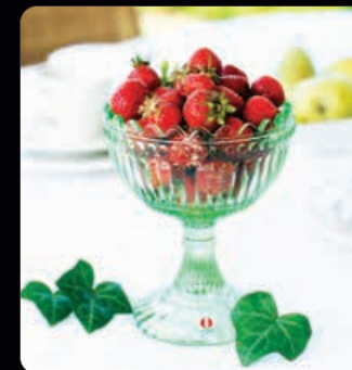
Marimekko skål litala 15,5 cm Klassisk skål från litala i färgen äppelgrön. Ett fint samlarobjekt, perfekt till servering eller dekoration.

Connaisseur Card EU går att skicka till alla EU-länder! En perfekt gåva för att visa uppskattning till viktiga utländska kontakter eller medarbetare. Gåvokortet går endast att lösa in på Internet via vår hemsida och är på engelska. Där får mottagaren fler produkter att välja bland, dessa varierar under året.