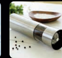
Peppermill 1 st