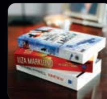
Pocketböcker 3 st