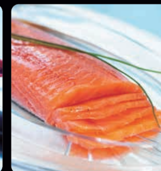
Kallrökt lax ca 850 g Renskuren och benfri lax av allra högsta kvalitet. Kallrökt på traditionellt vis. En given favorit på buffébordet!