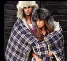
Colorado Bäddset 4 delar