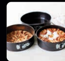
Bakformar 3 st