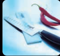
Japansk kockkniv 18 cm