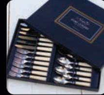
Ivory bestick 24 delar