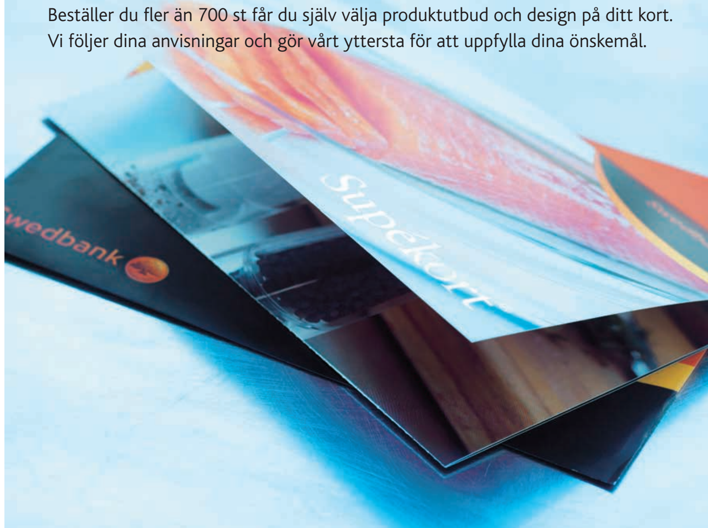
Gåvokort Supékort Exclusive

Beställer du fler än 700 st får du själv välja produktutbud och design på ditt kort. Vi följer dina anvisningar och gör vårt yttersta för att uppfylla dina önskemål.