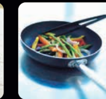
Stekpanna nonstick 28 cm