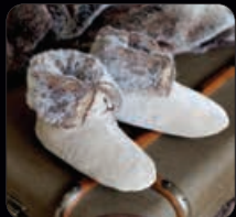
Aspen Booties 1 par