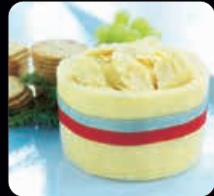
Whiskeycheddar 1400 g