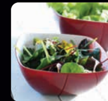
Salladsskål 1 st