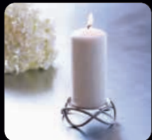
Georg Jensen ljusstake