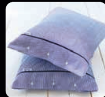
Riverhead Bäddset 4 delar