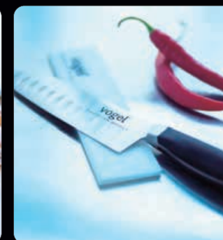
Japansk kockkniv 18 cm Profvisig kockkniv av tyskt kvalitetsstål, 1.4116-X50 Cr Mo V15, från Solingen. Bladlängd 18 cm.