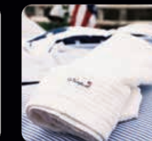
Newport Frotté 2 st