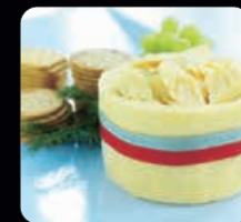
Whiskycheddar ca 900 g