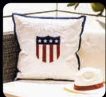
American Shield Pillow