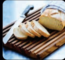
Skärbräda av akacia