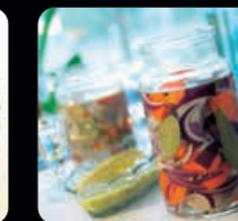
Sex sorters sill ca 1600 g