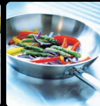
Traktörpanna 28 cm Av borstat rostfritt stål 18/10, med 6 mm sandwichbotten. Utmärkt för stekning, flambering och såser.