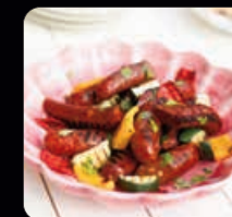
Lammkorv ca 500 g