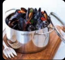
Gryta 3,5 liter