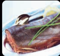
Varmrökt lax 1100 g