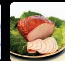
Rökt kalkon ca 700 g