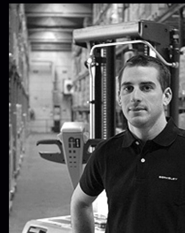
Vår personal skickar ca 250.000 paket per år.