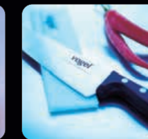
Kockkniv 20 cm