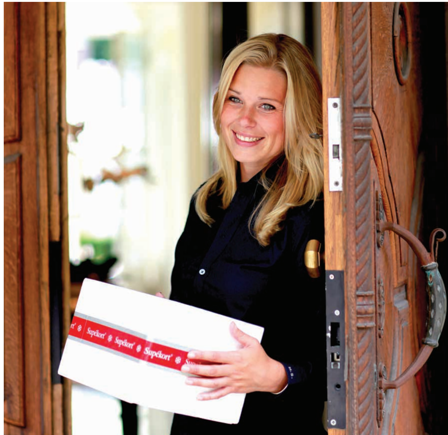
Logistisk Med Posten som stark partner

Vi har även tillgång till en egen kundtjänst på Posten, vilket innebär att vi kan spåra alla paket med hjälp av Postens egna sökvägar. Om något har inträffat, kan vi lösa det så snabbt som möjligt.