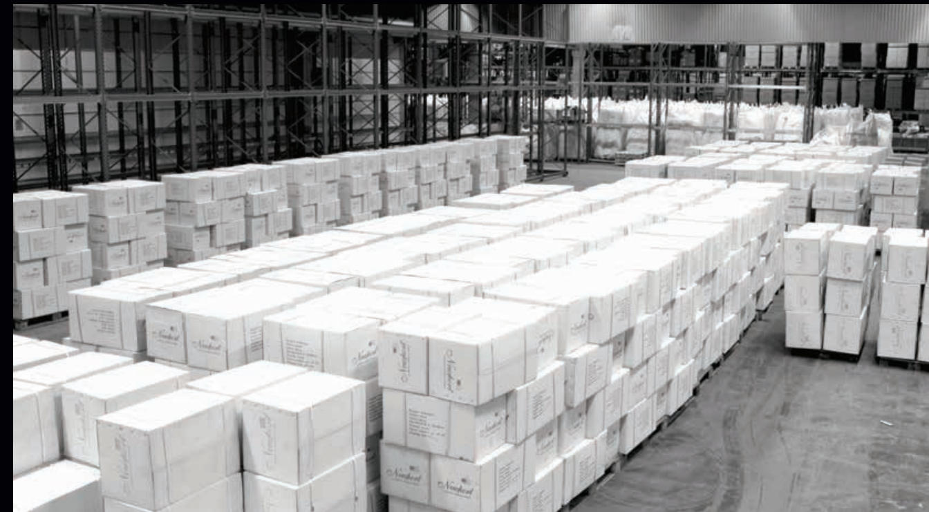
Vår lagerlokal på Saltängsgatan i Norrköping med en total lageryta på 3 500 kvm 2 .