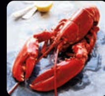
Hummer 2 x 350 g