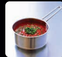
Kastrull med glaslock 1,5 L