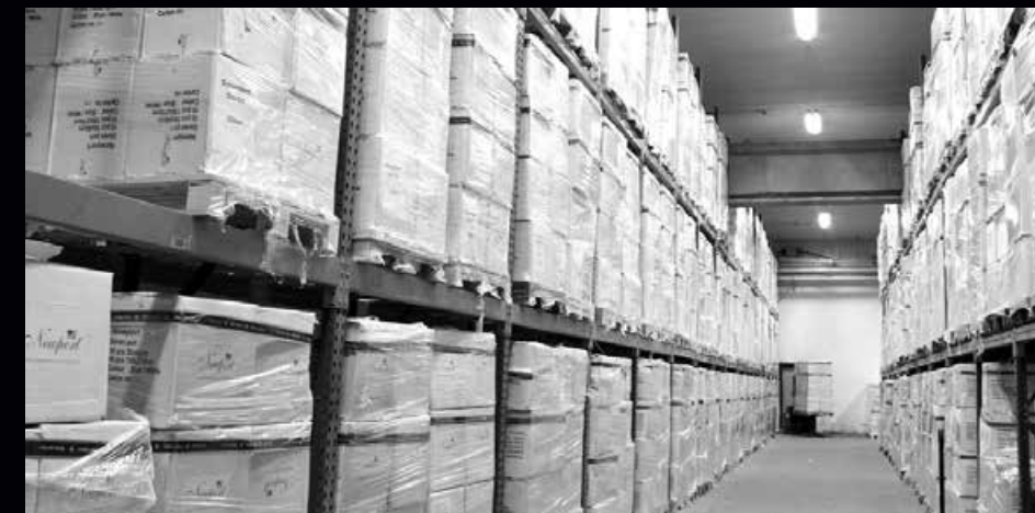
Vi har över 1.100 produkter i vårt produktsortiment som vi lagerhåller året runt.