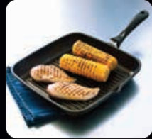
Grillpanna 28 cm