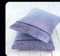
Riverhead Bäddset 2 delar