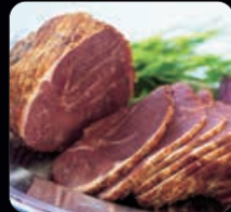
Rökt lammstek ca 1000 g